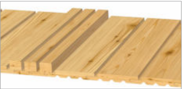
Gestaltungsvorschlag 1: 3x 40x68 mm, 3x 21x146 mm