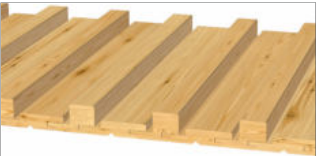
Gestaltungsvorschlag 3: 1x 21x96 mm, 1x 40x68 mm