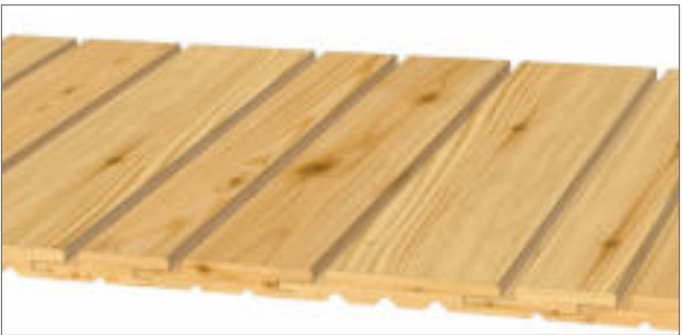
Gestaltungsvorschlag 2: 1x 21x96 mm, 1x 21x121 mm, 1x 21x146 mm